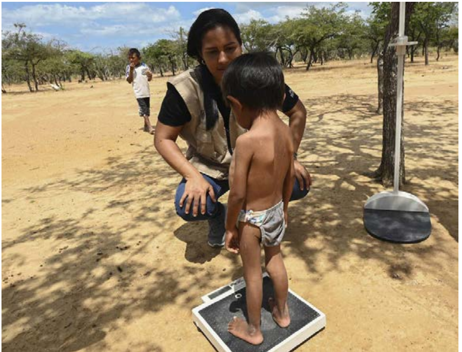
Una fuerte caída en las muertes de niñas y niños menores de cinco años por desnutrición aguda en el país.

El presidente también se refirió al comportamiento de esta problemática en departamentos de especial vulnerabilidad, destacando los siguientes avances: