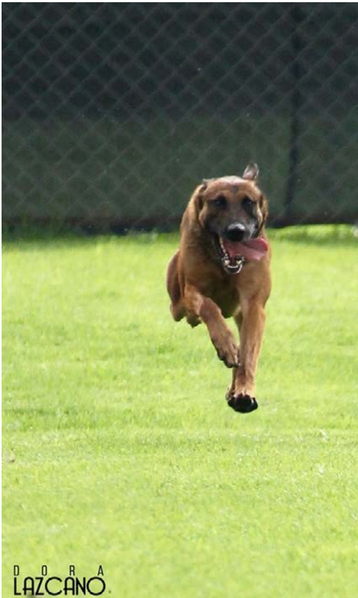
Es uno de los ejercicios de mayor control que demuestra que los perros no se entrenan en agresividad sino en control de impulsos, lo cual no resulta en un perro agresivo, sino un perro equilibrado.

Este deporte satisface las necesidades instintivas básicas ya que le permite canalizar su energía por medio de la mordida y la caza de su presa. El