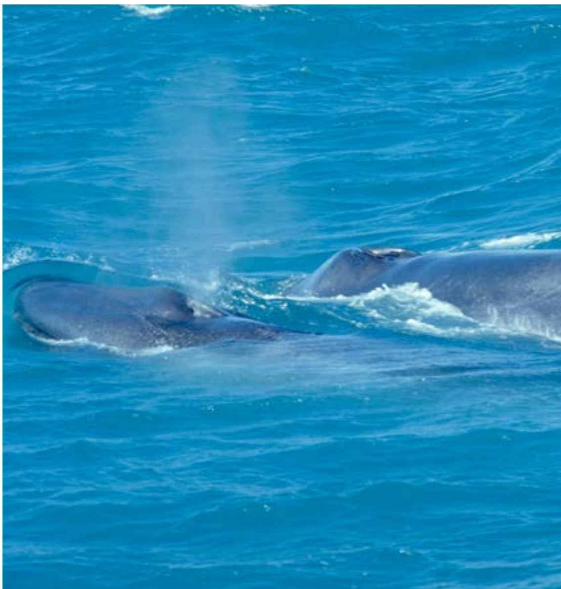
Un ejemplar joven con su madre.

Con Clic, llegar a los paraísos del avistamiento de ballenas es más fácil que nunca. Ofrecemos vuelos directos desde el aeropuerto Olaya Herrera de Medellín a Nuquí y Bahía Solano (Chocó), Tumaco (Nariño) y Guapi (Cauca). Si viajas desde Bogotá, Cali, Bucaramanga u otros destinos nacionales, puedes conectar con estos vuelos. La experiencia de avistar ballenas se complemen-