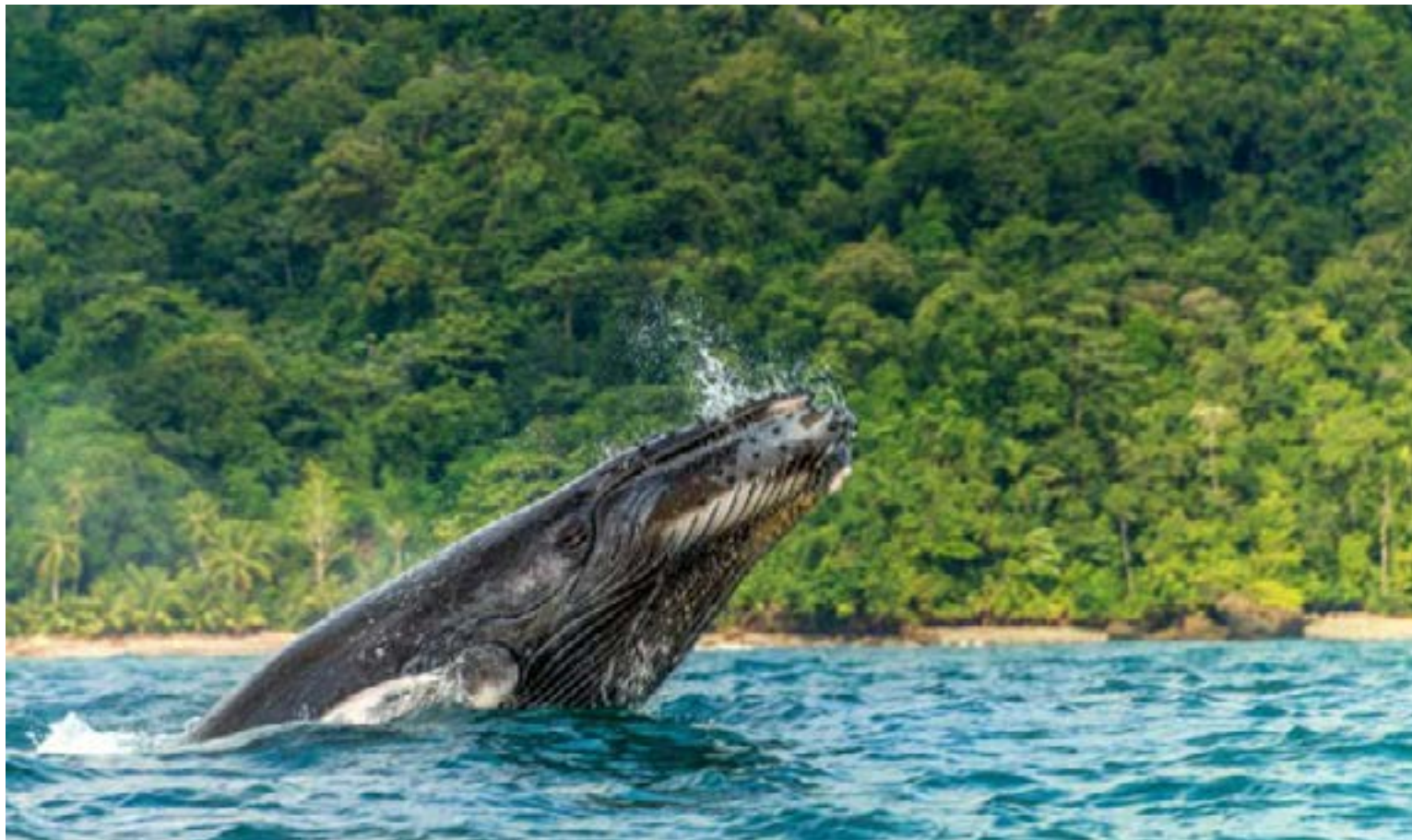
Ballenas jorobadas en el departamento del Chocó (Colombia)