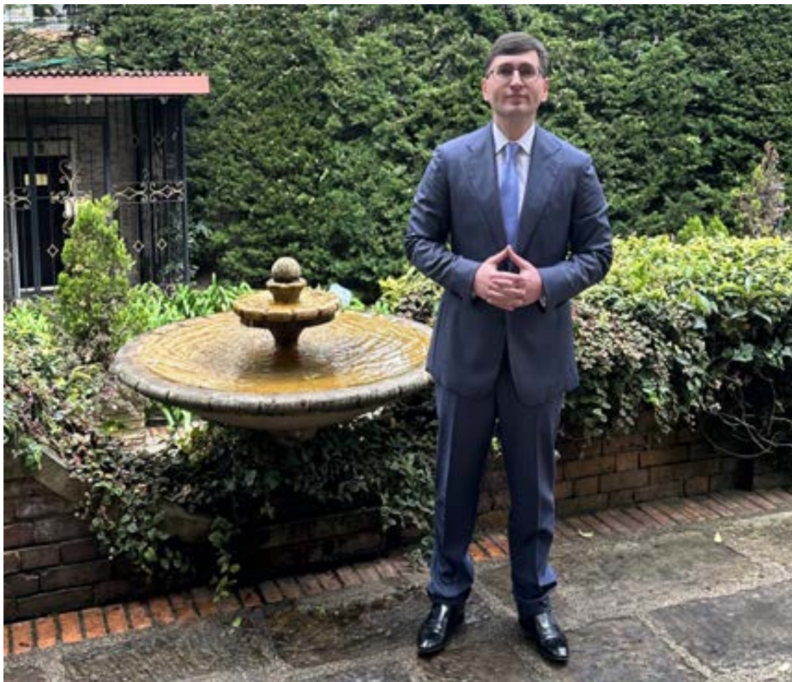
Azamat Kusaev, agregado cultural de la Federación de Rusia, en Colombia

-La cultura rusa es un fenómeno global, sinergia de múltiples pueblos-habitantes de nuestro país, desde la parte Europea y el Cáucaso hasta Siberia y Lejano Oriente. Todas esas culturas durante los siglos construyeron la civilización rusa. La con-