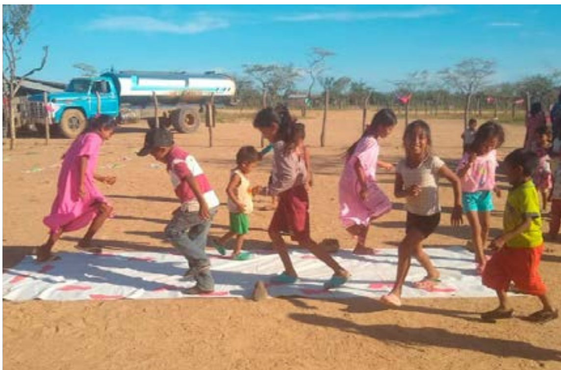
Los niños de La Guajira en la actualidad reciben alimentación y atención del Gobierno que se refleja en la alegría expresada en sus juegos.