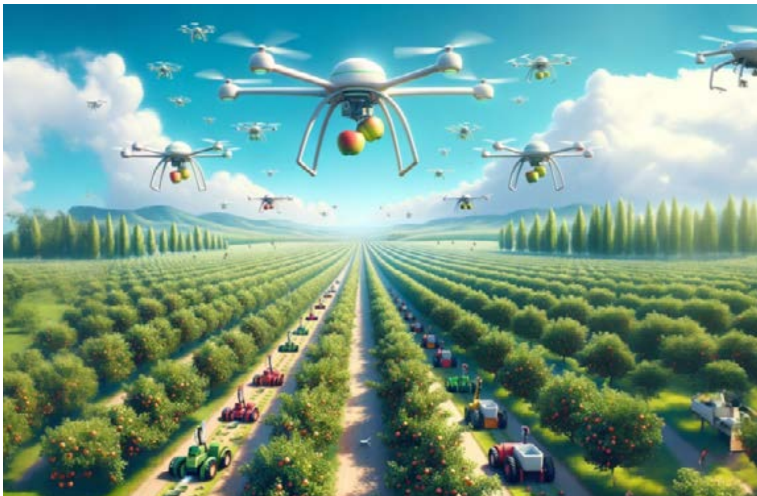
La tecnología al servicio de las tierras.

Aunque Colombia tiene un potencial agrícola, según la Agencia de Desarrollo Rural, el país sigue teniendo desafíos en cuanto a rendimiento y prosperidad, sobre todo entre los pequeños agricultores, problemática frente a la cual la Organización de las Naciones Unidas (ONU) promueve la agricultura inteligente, para adoptar tecnologías avanzadas para optimizar la producción de alimentos y escenarios desfavorables.