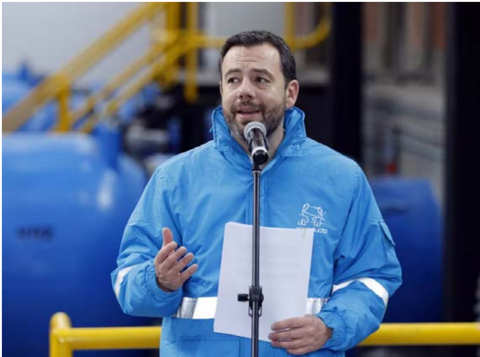
Carlos Fernando Galán, alcalde de Bogotá