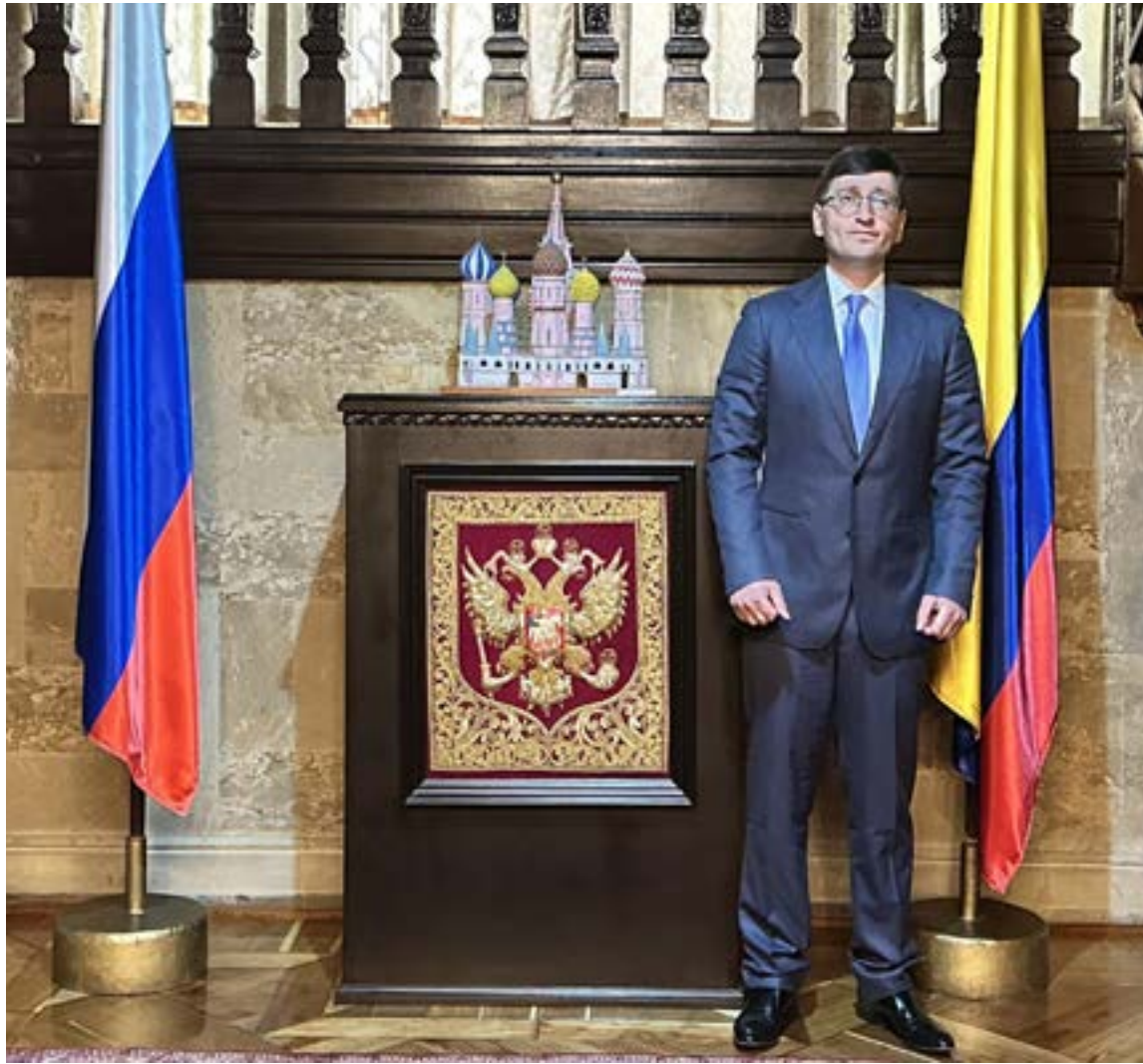
«Estamos viendo perspectivas para poder organizar las exhibiciones de los mejores museos de nuestro País en Colombia».

Rusia está activamente desarrollando su herencia teatral siendo una de las sedes de foros teatrales globales como el Festival Internacional Teatral de Chekhov celebrado en Moscú entre el 23 de mayo y el 25 de julio de 2025. Cabe mencionar, que Colombia fue representada de manera muy exitosa con dos piezas emblemáticas «El coronel no tiene quien le escriba», dirigida por Jorge Alí Triana, y «La Mansa», codirigida por el colom-