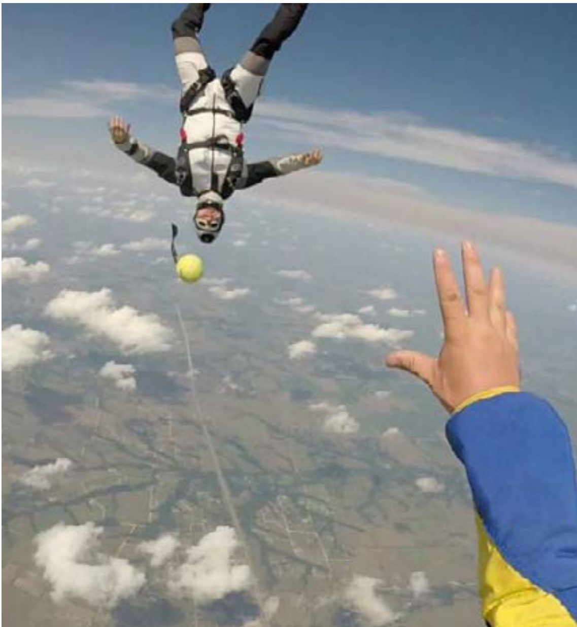
En algunas ocasiones se presentan accidentes cuando falla el paracaídas.