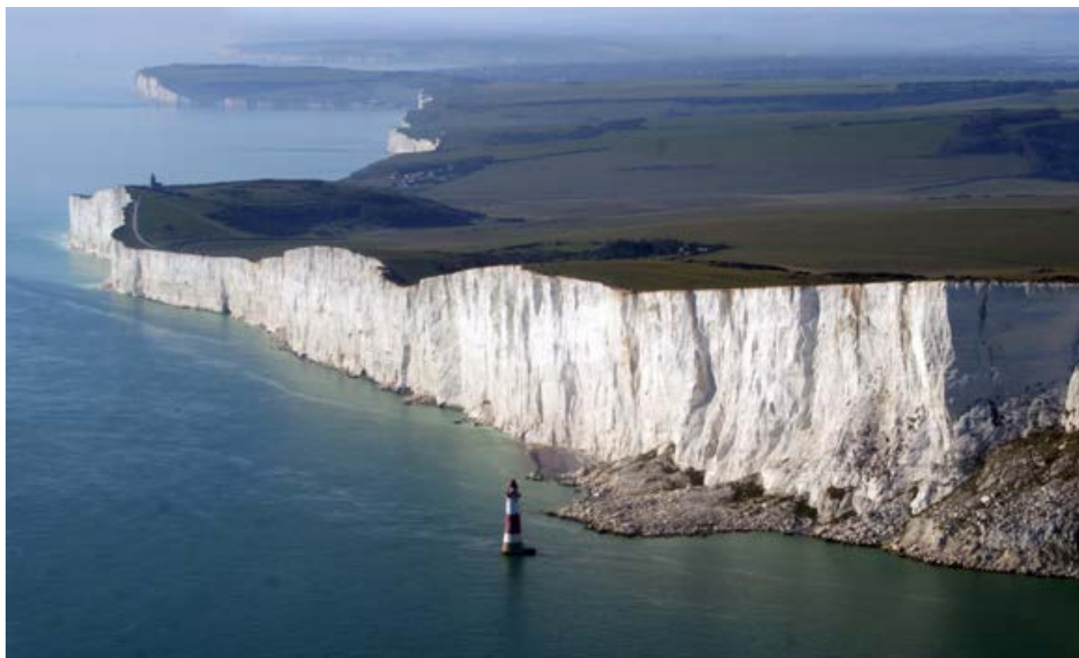
Agua de los océanos cada día ocupa mayor territorio en el planeta.

Los antiguos griegos usaron el término de los siete mares para cubrir las aguas de los mares Egeo, Adriático, Mediterráneo, Negro, Rojo y Caspio con el Golfo Pérsico; y posteriormente fue aplicada por la literatura europea medieval para describir los mares Norte, Báltico, Mediterráneo, Negro, Rojo y el Mar árabe, igualmente el Océano Atlántico. Lo cierto, hoy los mares forman parte de los océanos, que son mares de gran extensión separadores e integradores de